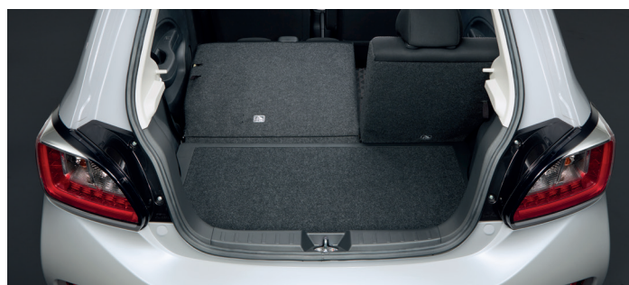
Oparcie tylnej kanapy składane w proporcjach 60:40