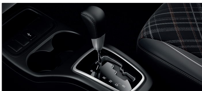
Automatyczna skrzynia biegów