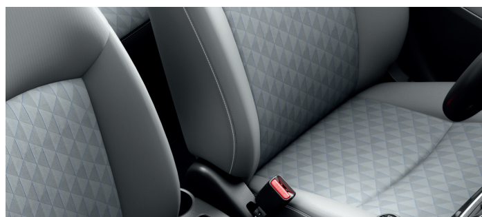
Jasnoszara tapicerka tekstylna