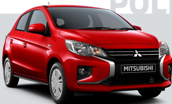
1.2 Invite SDA MT