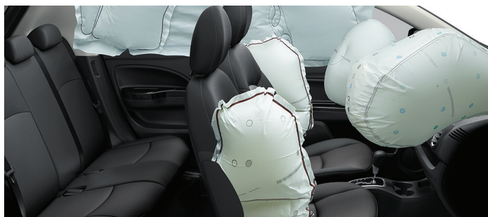
6 poduszek powietrznych w standardzie